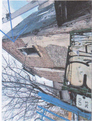
FISURI LA BUANDRUGI